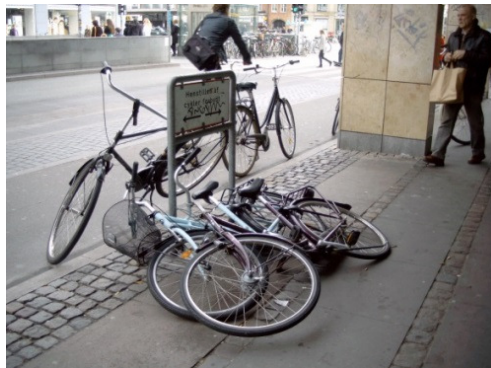
(Abb. 2) Der Datenträge (Metallrahmen) lädt ein zu tun, was verhindert werden soll, Beispiel (31)