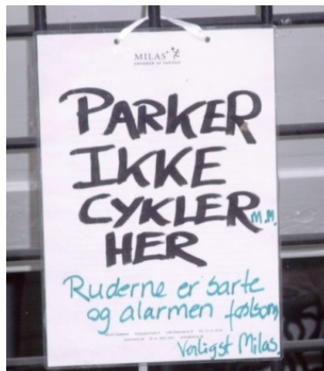
(Abb. 1) Aufsteller vor Geschäft, Kopenhagen, Beispiel (19)

Wenn die Begründung keinen sachgemäßen Inhalt hat wie in (20), wo auf ein Rollenstereotyp angespielt wird, soll sie als humorvoller Hinweis die Kooperationsbereitschaft der Adressaten fördern.