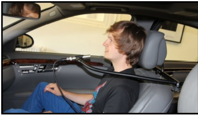
Abbildung 1: Die Position des Mikrofons am Beifahrersitz während der Sprachaufnahmen.