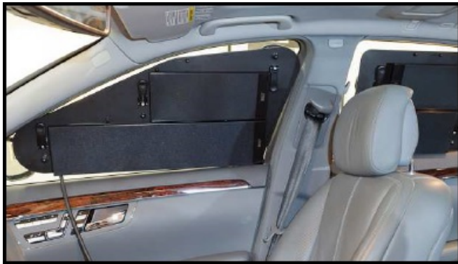
Abbildung 2: Die Positionen der Lautsprecher an den Fenstern der rechten Fahrzeugseite während der Sprachaufnahmen.

Zur Elizitation von Spontansprache und damit zur Steigerung des Lombard-Effekts wurde die interaktive Sprechaufgabe des Video Task gewählt [6], die bereits am Institut für Phonetik und Digitale Sprachverarbeitung der Universität Kiel als sogenanntes 'Daily Soap Szenario' angewendet wurde [11,12]. Dabei werden verschiedene Sequenzen einer bekannten Fernsehserie derart zusammengeschnitten, dass zwei ähnliche, aber nicht identische Videos entstehen. Diese unterscheiden sich in der Auswahl, der Reihenfolge und der Vollständigkeit der Szenen und sind etwa 15 Minuten lang. Im Experiment der vorliegenden Studie sah sich jeder Dialogpartner eines der Videos zweimal an. Während der darauffolgenden Sprachaufnahmen sollten die Probanden das Gesehene vergleichen und dabei Ähnlichkeiten und Unterschiede diskutieren. Um möglichst ungezwungene spontansprachliche Dialoge zu erhalten, wurden nur Dialogpartner gewählt, die sich bereits gut kannten.