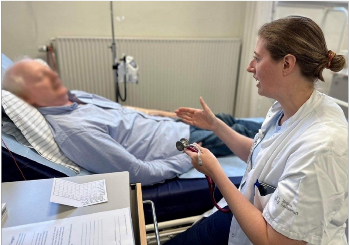
Foto bringes med patientens tilladelse.