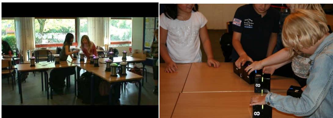
FIGURE 1 (A) FRACTION BATTLE; (B) NUMBER BLOCKS

In order to treat the two cases uniformly, it is necessary to use a research method that can be adapted for different design cases. The method chosen also needed to support the inclusion of the target group as active participants and co-creators. The research method chosen was a combination of Action Research and Design-based Research named Design-based Action Research. The method is iterative and based on interventions in each iteration where the target group, developers, and researcher perform an activity, e.g. brainstorming, or testing the educational tool (Lewin, 1946; Figueiredo, 2007; Barab & Squire, 2004; Sharp, 2007; van den Akker, 2006).