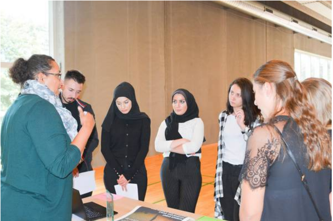
Studerende fra Syddansk Univeristet besøgte Vissenbjerg Skole.