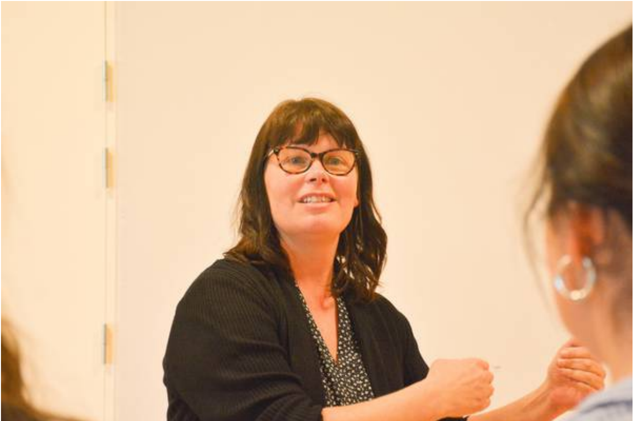
Studerende fra Syddansk Univeristet besøgte Vissenbjerg Skole.