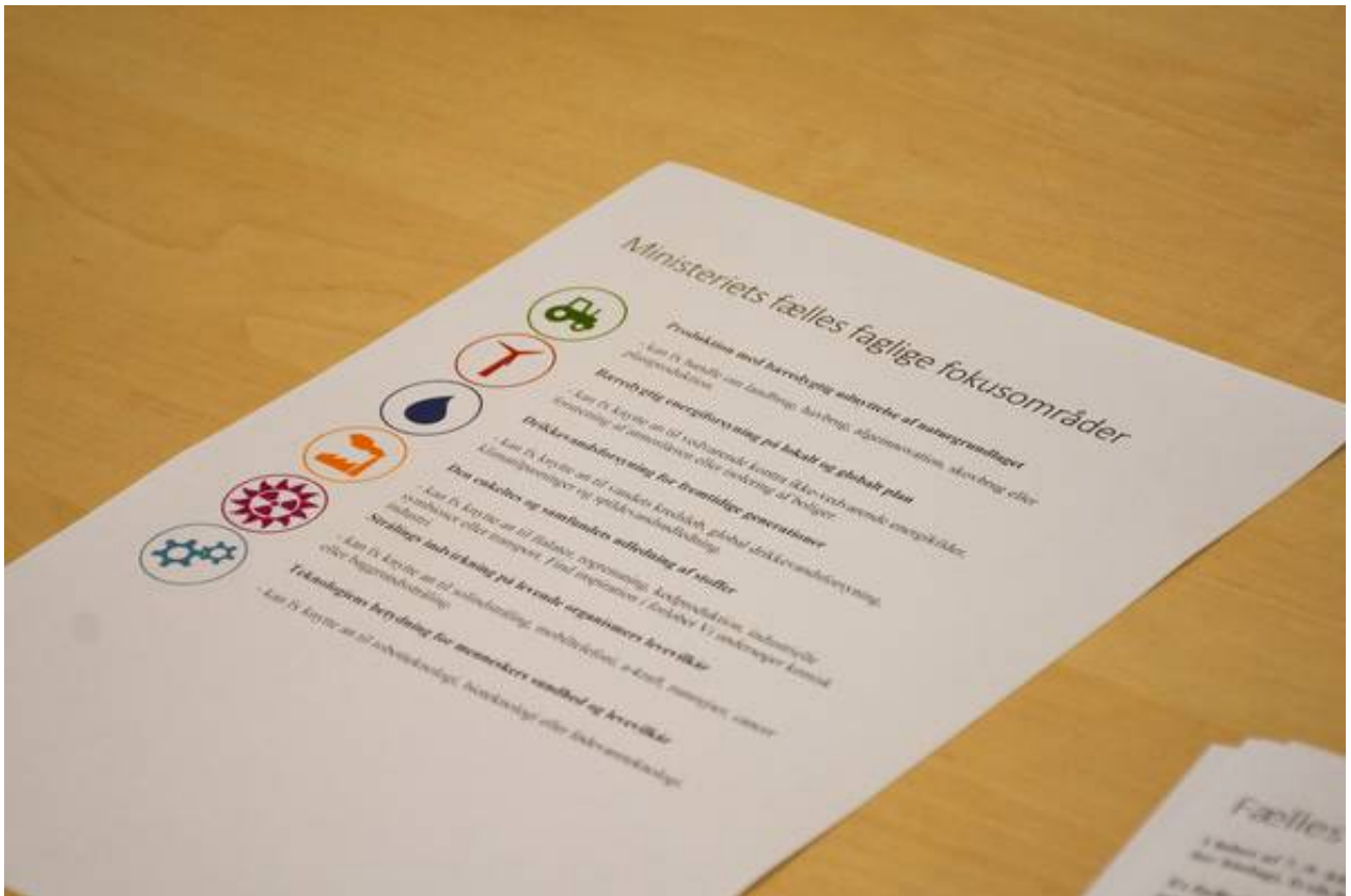
Studerende fra Syddansk Univeristet besøgte Vissenbjerg Skole.