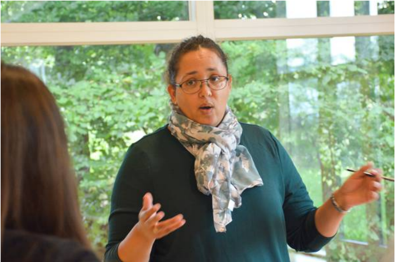
Studerende fra Syddansk Univeristet besøgte Vissenbjerg Skole.