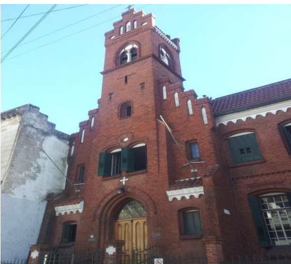
Den danske kirke i bydelen San Telmo i Buenos Aires.