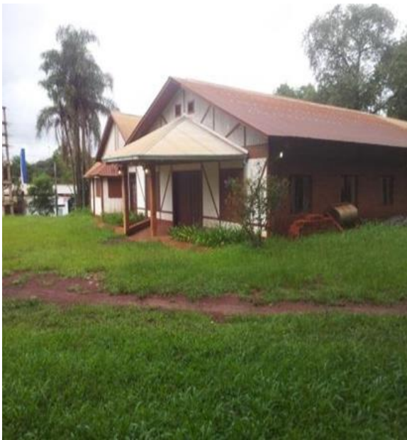
Haabet, det danske forsamlingshus i Eldorado.