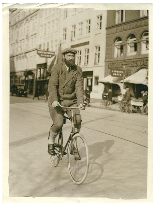
Peter Freuchen på cykel i Vester Voldgade – måske på vej fra Politiken som han i perioder arbejdede fra 1909 til sin død.